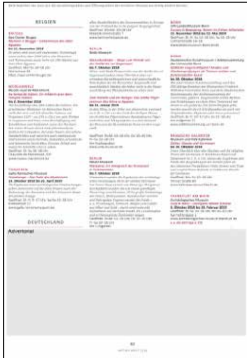
1/3 Seite quer Satzspiegel: 181 x 89 mm Anschnitt: 210 x 111 mm*

Ein besonderer Blickfang für Ihre Werbepresenz in der ANTIKE WELT. Seit 2019 haben wir die beliebte Rubrik „Ausstellungskalender“ für Advertorials des Formats 1/3 Seite quer und hoch geöffnet.