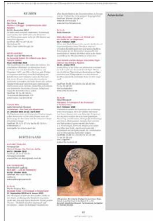
1/3 Seite hoch Satzspiegel: 57 x 252 mm Anschnitt: 67 x 297 mm*

Das Advertorial wird von der Redaktion unter Beachtung des Zeitschriftenlayouts und -Designs gesetzt. Für die Datenlieferung werden benötigt: ein bis zwei Abbildungen (mind. 300 dpi) sowie Text (1000 Z. inkl. Leerzeichen)